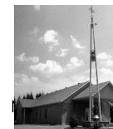
Nativité de Marie

PAROISSE BIENHEUREUX-LOUIS-ZÉPHIRIN-MOREAU