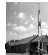
Nativité de Marie