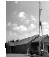
Nativité de Marie

PAROISSE BIENHEUREUX-LOUIS-ZÉPHIRIN-MOREAU