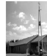
Nativité de Marie