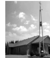
Nativité de Marie

PAROISSE BIENHEUREUX-LOUIS-ZÉPHIRIN-MOREAU