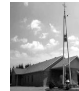
Nativité de Marie