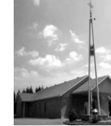
Nativité de Marie