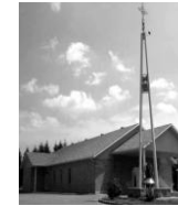
Nativité de Marie