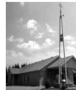
Nativité de Marie